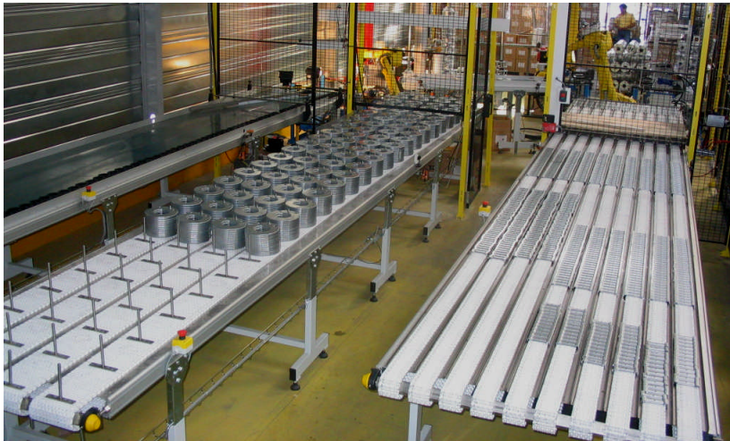
Convoyeurs de stockage et approvisionnement asservi de gros volumes de composants

Optimisation des phases d'approvisionnement, cohérence des capacités de stockage, autonomie et ergonomie des postes opérateur.